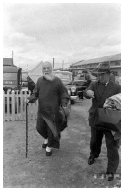
1949 年 4 月，于右任离沪

这是他眷恋大陆家乡所写的哀歌，其中怀乡思国之情溢于言表，是一首触动炎黄子孙灵魂深处隐痛的绝唱。阅读此诗，给人一种悲怆深沉、爱国情挚的感觉。由于众所周知的原因，于先生久居台湾，不能回归桑梓，但是海峡波涛却隔不断、阻不了他望大陆、念故乡、思亲人的深情。