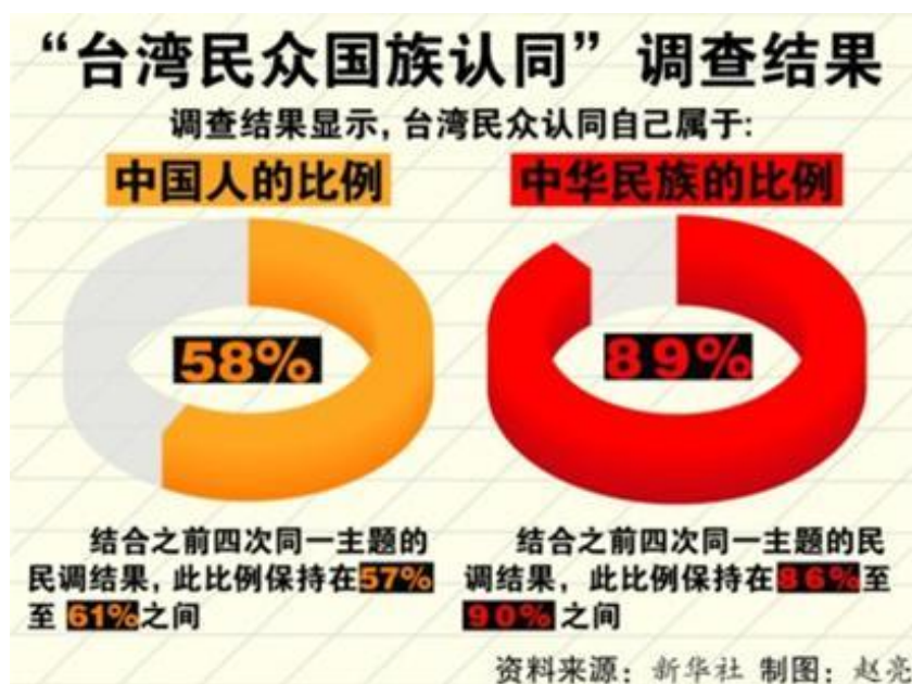
2013 年 5 月台湾竞争力论坛第二季“台湾民众国族认同”调查结果

的大陆社会来说，使得海峡两岸很有机会从过去的对立，变为当前的和解，再进而成为未来的融合。据台湾竞争力论坛“2014 台湾民众国族认同第 3 季调查”调查结果，显示台湾民众在具有共同血缘、语言历史文化的前提下，认同自己是“中华民族一分子”的比例为 87%，相较上一季的 83.8%，增加 3.2%，为连续近 5 次调查最高；否认者的比例仅为 9%。整体而言，台湾民众认同中华民族的比例皆保持在 8 成以上，否认自己是中华民族的比例则维持在一成左右，显示了台湾民众国族认同的高稳定度。我们应充分把握这项利基，为未来发展争取更多的资源和机会。